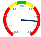
Årets kapitalförändring (% av intäkter)